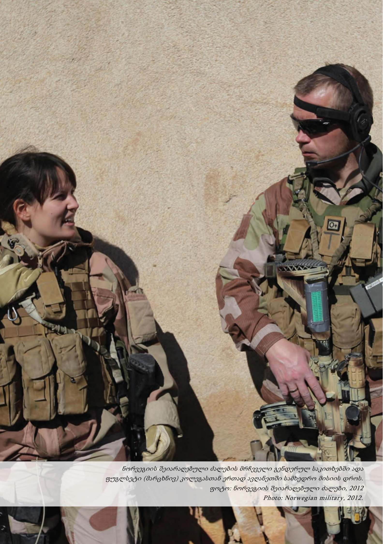
ნორვეგიის შეიარაღებული ძალების მრჩეველი გენდერულ საკითხებში ადა ფუგლსეტი (მარცხნივ) კოლეგასთან ერთად ავღანეთში სამხედრო მისიის დროს.