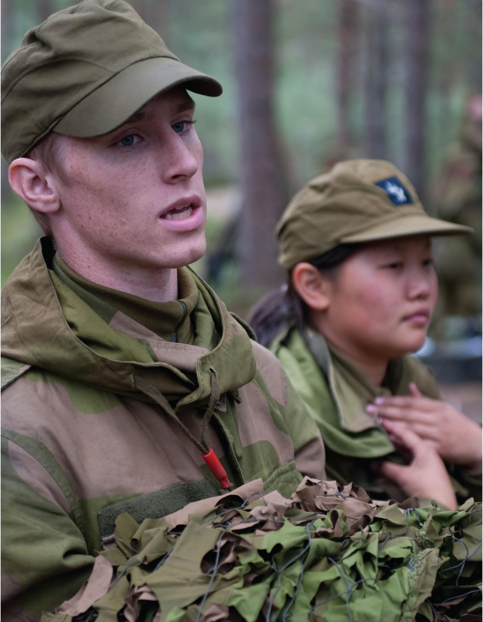
ნორვეგიის შეიარაღებული ძალების წარმომადგენლები. ფოტო: Soldanytt, 2010.